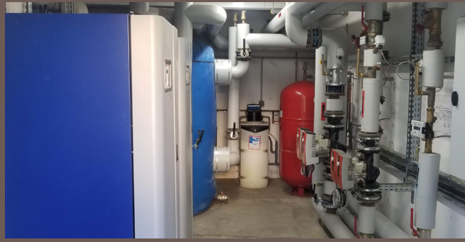
Intérieur de la chaufferie